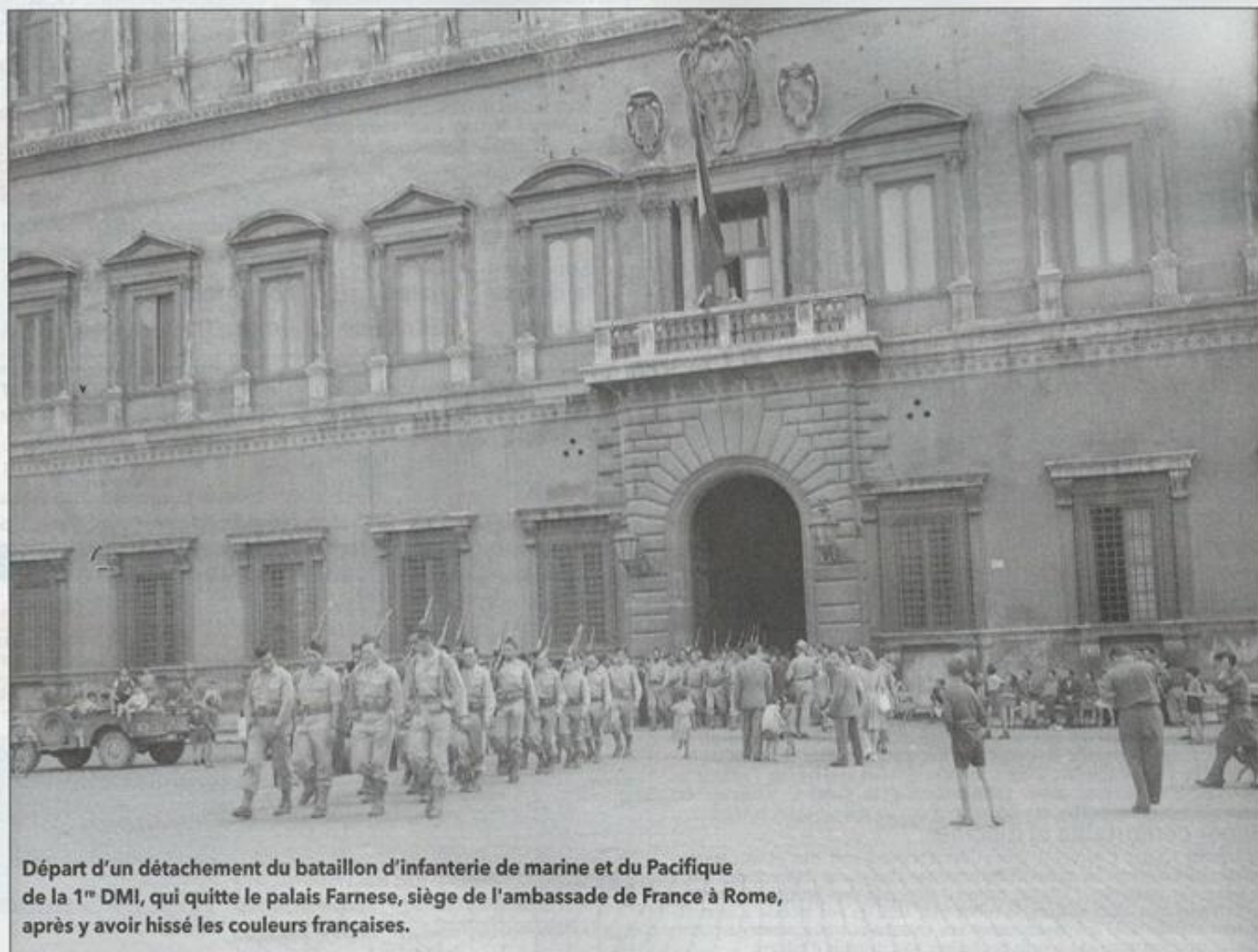
Départ d'un détachement du bataillon d'infanterie de marine et du Pacifique de la 1 re DMI, qui quitte le palais Farnese, siège de l'ambassade de France à Rome, après y avoir hissé les couleurs françaises.

parmi d'autres, au sein de l'armée française renaissante. À compter du 1 er mai 1944, la 1 re DFL change d'appellation et devient la 1 re division de marche d'infanterie (1 re DMI), mais ceux qui y servent continuent de l'appeler « 1 re DFL ». Le général Diego Brosset, chef charismatique, a succédé au général de Larminat à la tête de la division qui, équipée en matériels anglais, est organisée en trois brigades d'infanterie. La 1 re brigade est composée de deux bataillons de la 13 e demi-brigade de Légion étrangère et du 22 e bataillon de marche nord-africain. La 2 e brigade regroupe trois bataillons de marche et la 4 e brigade, deux bataillons de marche et le bataillon d'infanterie de marine et du Pacifique. Singularité de cette division, son régiment blindé est un régiment de fusiliers-marins, commandé par le capi-